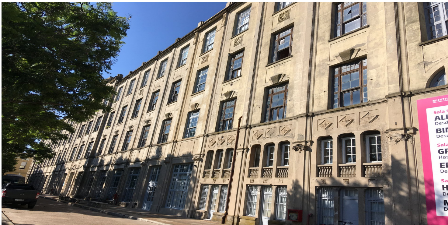
Budynek, w którym mieścił się hotel imigrantów (zbudowany w 1906 r.) – dziś siedziba Muzeum Imigracji w Buenos Aires

https://przystanekhistoria.pl/pa2/tematy/ameryka-lacinska/93116,Jest-taki-kraj-Jest-taka-biblioteka.html