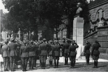
Odśonięcie pomnika Józefa Piłsudskiego na terenie Fortu Winiary, 1930 r.