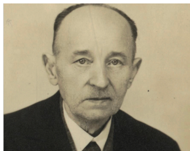
Józef Guliński