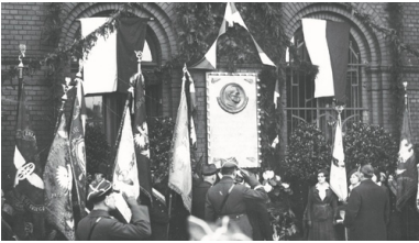
Odśonięcie tablicy upamiętniającej Józefa Piłsudskiego na fasadzie dworca kolejowego w Poznaniu, 1934 r.