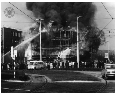
Płonący budynek Kombinatu Gastronomicznego „Kaskada”. Po lewej stronie zdjęcia widać fragment budynku należącego do Zakładów Przemysłu Odzieżowego „Odra”, 27 kwietnia 1981 r.