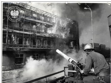
Strażak na wozie strażackim gaszący pożar „Kaskady” w Szczecinie, 27 kwietnia 1981 roku

Sztuczny materiał, z którego zrobione były fotele, paląc się wytworzył gaz bojowy – fosgen. To właśnie nim zatruta się większość ofiar. Tylko nieliczni zdołali się uratować. Jedna z kobiet została „ewakuowana” za pomocą podnośnika, którym pracownicy MPGK jechali do pracy. Temperatura była tak wysoka, że w samochodach strażackich łuszczył się lakier, a zaparkowane nieopodal auta spłonęły. Stopiły się również znaki drogowe oraz nylonowe firanki w pobliskich oknach. Po godzinie „Kaskady” już nie było, a do wieczora dogaszano jej zgliszcza.