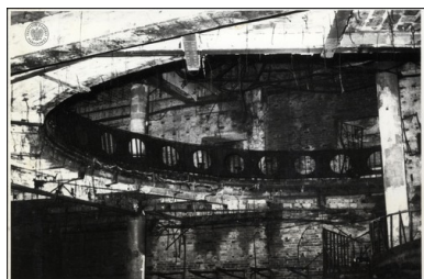
Wnętrze spalonej Sali Kapitańskiej znajdującej się w „Kaskadzie” po pożarze w dniu 27 kwietnia 1981 r.