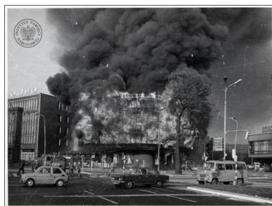
Płonący budynek Kombinatu Gastronomicznego „Kaskada”, 27 kwietnia 1981 r.

W latach dwudziestych XX w. stara kamienica, położona u zbiegu dzisiejszych Alei Niepodległości i ulicy Bałuki, została przebudowana w modnym wówczas modernistycznym stylu. W czterokondygnacyjnym gmachu powstał kompleks gastronomiczny „Haus Ponath”. Obiekt słynął z nowoczesności i wysokiej jakości usług. Działała tam kawiarnia, sala taneczna, restauracja, sala zabaw, pokój gier itd. Po wojnie przez jakiś czas w budynku mieścił się dom towarowy, po czym pod koniec lat pięćdziesiątych postanowiono przywrócić mu pierwotną funkcję.