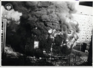
Pożar K o m b i n a t u Gastronomicznego „Kaskada”, 27 kwietnia 1981 r.