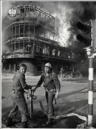
Strażacy gaszący pożar „Kaskady” w Szczecinie, 27 kwietnia 1981 r.

21 kwietnia 1962 r. swoją działalność zainicjował Kombinat Gastronomiczny „Kaskada”. Był to w istocie kombinat, pełniący funkcje rozrywkowe. Na parterze mieściła się luksusowa restauracja „Kapitańska”, na pierwszym i drugim piętrze kolejne dwa lokale gastronomiczne – „Rondo” i „Słowiańska” – przeznaczone jednak dla klientów o mniej pojemnych portfelach. Na ostatniej kondygnacji usytuowano kawiarnię. „Kaskada” szybko stała się bardzo popularna, głównie za sprawą marynarzy, którzy przybijali do szczecińskiego portu, wówczas największego na Bałtyku. Na czterech kondygnacjach kapitalistyczny Zachód stykał się z