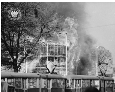
Fragment płonącego budynku Kombinatu Gastronomicznego „Kaskada”, 27 kwietnia 1981 r.