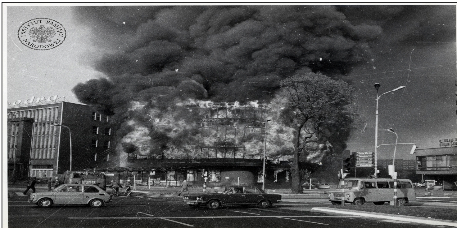
Płonący budynek Kombinat Gastronomicznego „Kaskada”, 27 kwietnia 1981 r. (fot. z zasobu IPN)

https://przystanekhistoria.pl/pa2/teksty/106801,Wielki-pozar-szczecińskiej-Kaskady-27-kwietnia-1981-r.html