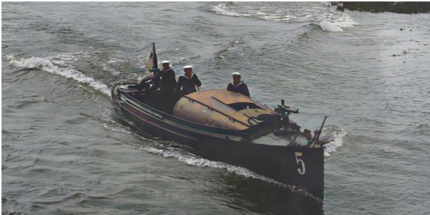
Polska motorówka uzbrojona z Flotylli Rzecznej MW w Pińsku, II połowa lat 20-tych XX w. (zdjęcie poglądowe ze zbiorów NAC, koloryzacja Paweł Bezubik)

https://przystanekhistoria.pl/pa2/teksty/106771,Polska-Marynarka-Wojenna-w-wojnie-polsko-bolszewickiej-i-bitwa-pod-Czarnobylem-1.html