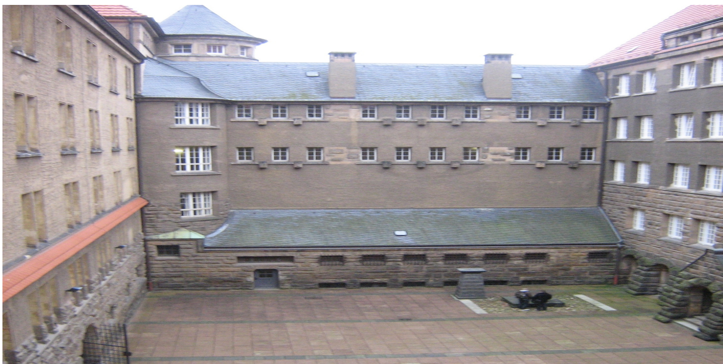
Plac na którym wykonywano egzekucje

https://przystanekhistoria.pl/pa2/teksty/106758,Egzekucja-zolnierzy-Narodowych-Sil-Zbrojnych-w-Dreznie.html