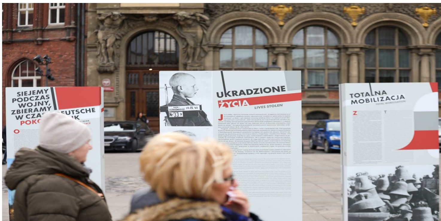
Wystawa IPN „Gospodarka III Rzeszy” w Gdańsku - 17 marca 2023.

https://przystanekhistoria.pl/pa2/teksty/106755,Rasowo-wartosciowe-Germanizacja-dzieci-polskich.html