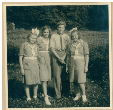
Karta z kroniki „Wędrownych Ptaków”