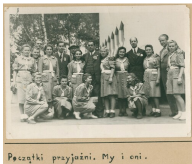
Karta z kroniki „Wędrownych Ptaków”