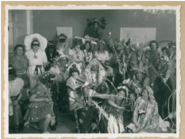
Karta z kroniki „Wędrownych Ptaków”

Liczyła cztery zastępy: „Bociany”, „Jaskółki”, „Pisklaki” oraz „Dzikie gęsi”. Na terenie obozu w Doverstorp, położonego w lesie, drużyna znalazła uroczysko, w którym niemal codziennie odbywały się zbiórki. Dziewczęta nosiły mundurki przygotowane z niebieskich roboczych fartuchów, które ozdabiały białymi kołnierzykami, paskami i sznurami, uplecionymi z białej bibuły. W drużynie pracowano w oparciu o stopnie i sprawności harcerskie, a w ramach ich zdobywania urządzano różne imprezy dla harcerek i wszystkich Polek z obozu.