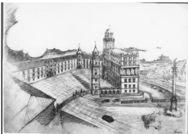
Projekt Zamku Królewskiego

Budowa Pałacu Kultury i Nauki wywarła również negatywny wpływ na odbudowę substancji historycznej. Socrealistyczna estetyka Pałacu wpływała na formy planowanej odbudowy budynków historycznych, przy której ówczesne władze odrzucały co do zasady „strupieszale”, jak wyraził się Bolesław Bierut, podejście konserwatorów zabytków na rzecz swobodnego przekształcania przestrzeni, których przykładami były wizje odbudowy Zamku Królewskiego czy Zamku Ujazdowskiego w Warszawie (z przeznaczeniem na Teatr Wojska Polskiego).