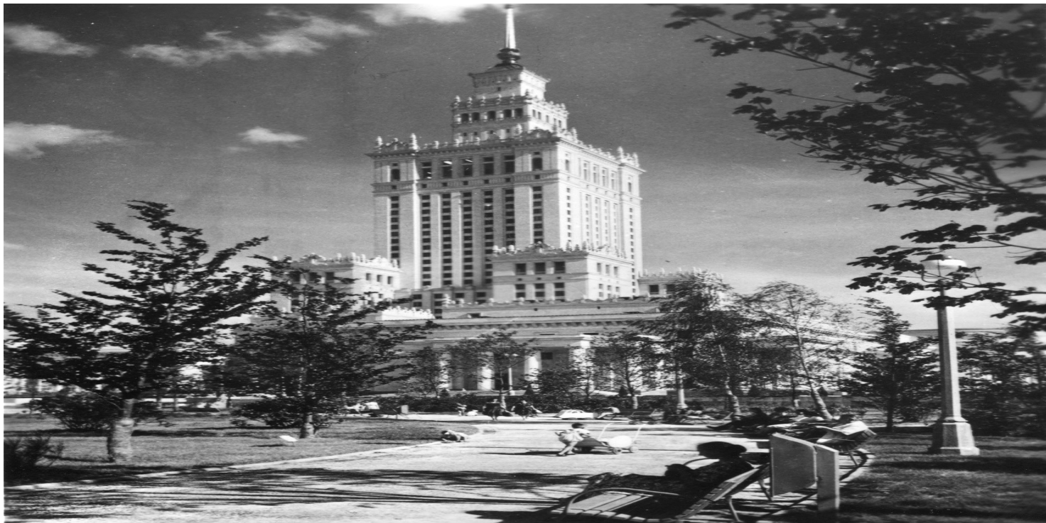
Pałac Kultury i Nauki, domena publiczna

https://przystanekhistoria.pl/pa2/teksty/106692,Socrealizm-w-Polsce.html